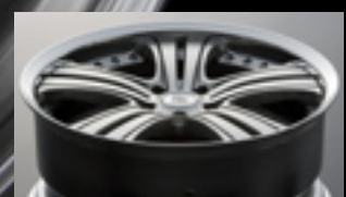
ディスク面は、センターに落とし込みを持たせているのが特徴。さらに、2ピース構造ならではのディープリムも魅力的だ。

ナプレジャパンの中で上級モデルとして登場したパラディソ。巧みなスリットワークで見る者を魅了するデザイン性の高いブランドだ。その第3弾となる新作ホイールが登場した。 1番の特徴といえるのが、「3Dスリットライン」。リム側に広がるツインスポークを分けるようにラインが入る。そのラインは、彫刻刀で削り出したようにサイド部を斜めにカット。直線的なラインに深みを与え、よりディスクに立体感を与えている。リムには、マルチピースを証明するピアスホルトが鎮座。力強さと上質な雰囲気を与えてくれるのだ。また、ホイール本体のカラーごとに標準装備するセンターオーナメントも様々。ハイパーポリッシュには「ポリッシュXポリッシュ」、ブラックポリッシュには「ポリッシュXブラック」、クロームには「クロームXポリッシュ」が付属。そのほかにも、ブランドロゴがレッドのオプション設定もある。